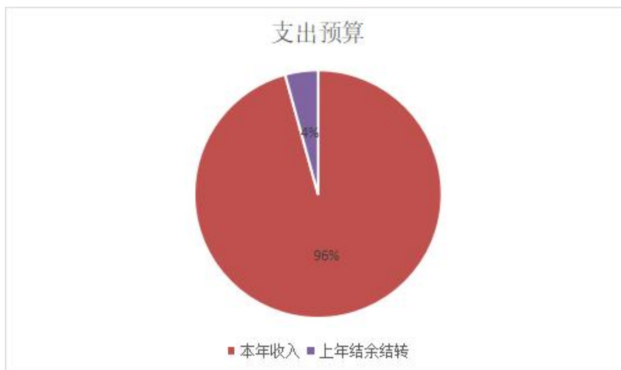
图 1. 收入预算图